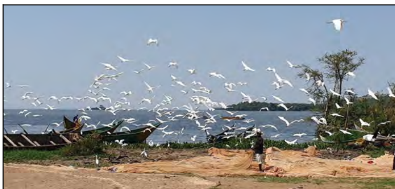
Jazero Viktoria...rybarska dedina.