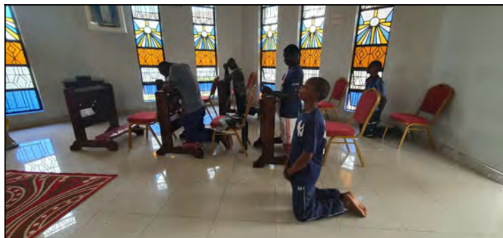
Treba vediet aj Bohu povedat'..Dakujem.