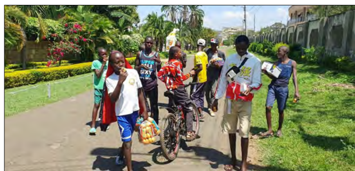
Na ceste z kostola sme sa zastavili u pána Suresa a dal nám dajake jedlo.