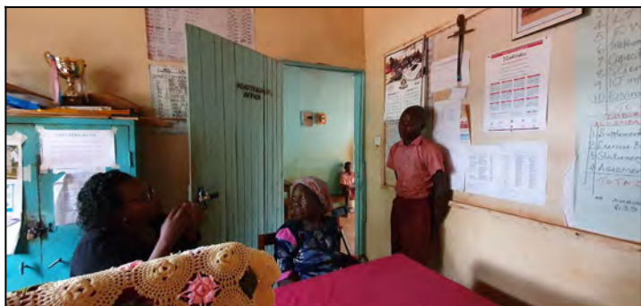
Sydney uiekol z domu,,priviedli sme ho na spät.