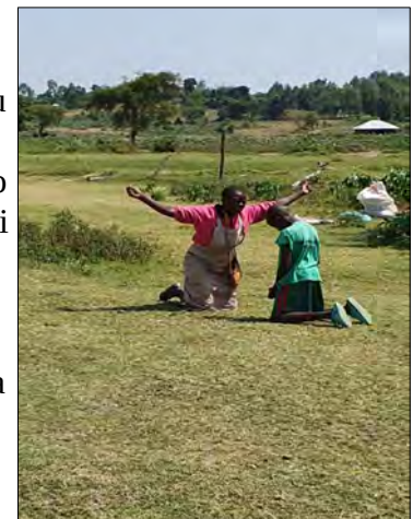
Silasova mama keď ho uvidela.