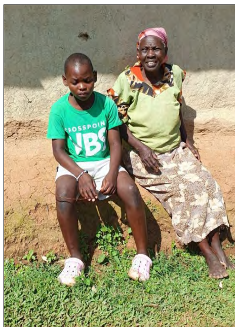
Ajub 12ra jeho stareнка.