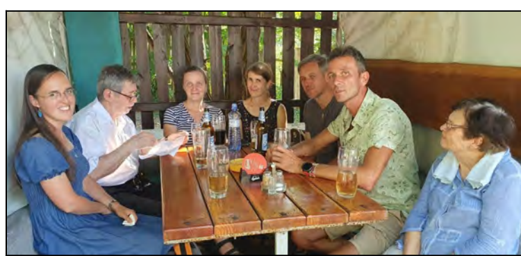
Bývalí Seleziansky misionari..ktorý posobili Cad,Kena,Rusko-Sibir, Južný Sudan a Azerjbajdzan