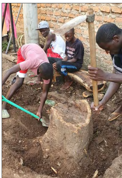
Vykopávanie kmeňa stromu.