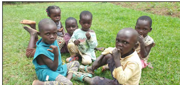
Slovenske cukriky ich chutia.