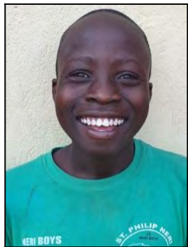
John Mark 15