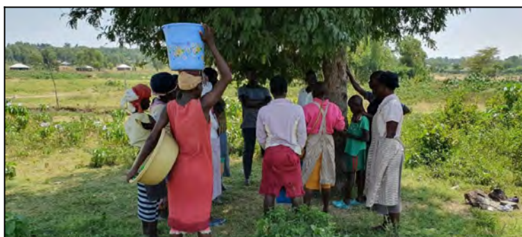
Zeny pri jazere.