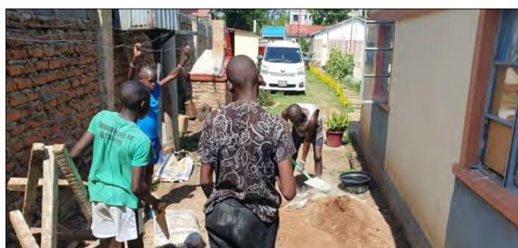
Chlapci miešajú beton na nový podstavec pre vodnú nádobu.