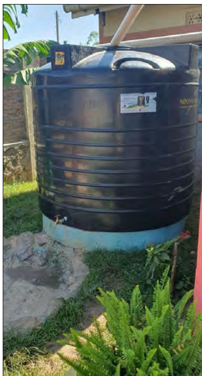
Nová vodná nádrž 3500 L