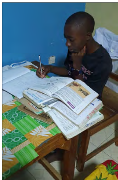
Exam KCPE sa blíži...treba študovať.