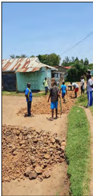
Oprava cesty do centra