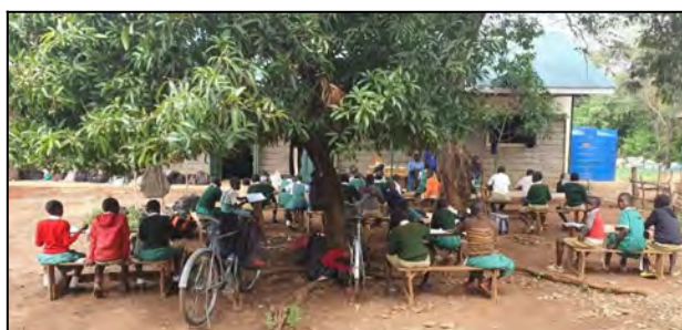
Skúšky vonku pod stromom.