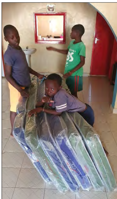
Nove madrace pre centrum.