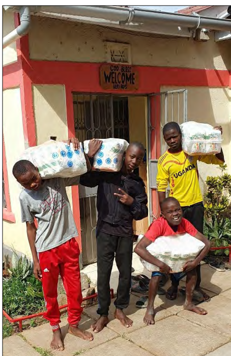
Dar od Dominiky...