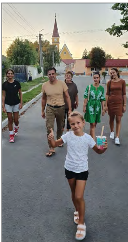
Posledná večera pred odletom.