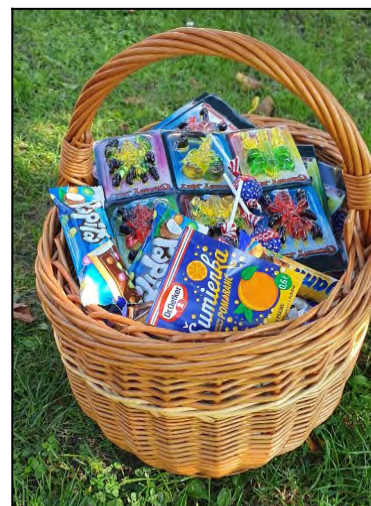
Cukriky od Zuzky.