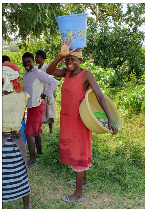
Rybárska žena pri jazere Viktoria