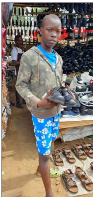
Nove topánky do školy...Briton

Fotky chlapcov ktorý prišli do centra Filipa Neriho v tomto období.