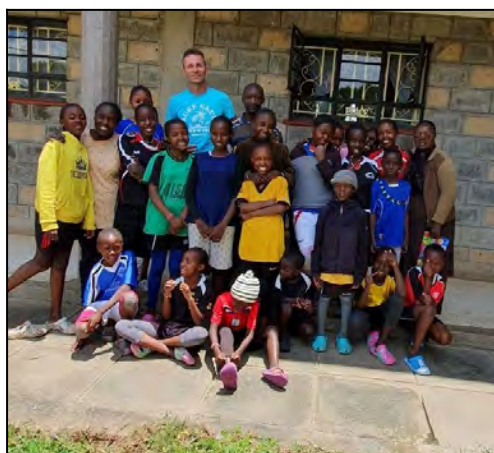
St Theresa centrum-Naivasha