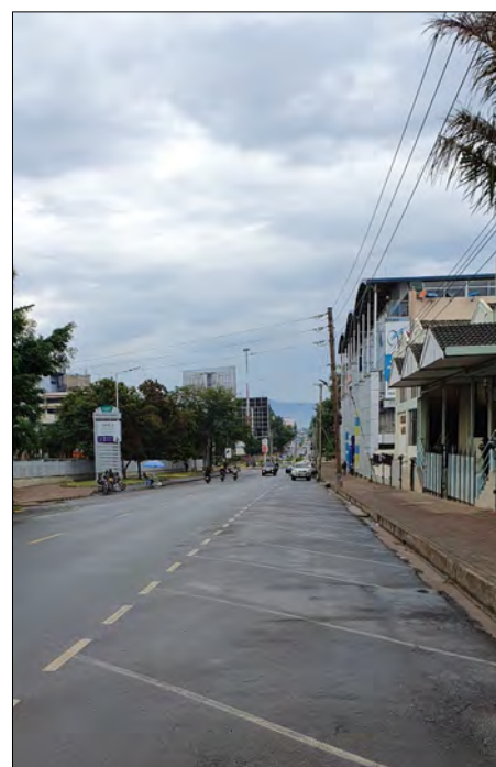
Zvyčajne preplnené ulice v Kismu počas demonštrácií.