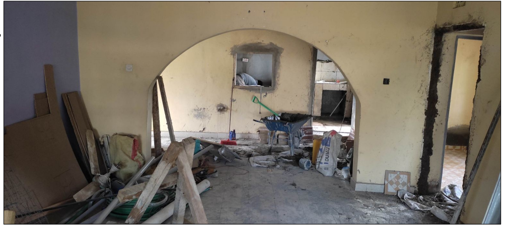
Nove centrum. Vstupna miestnosť...buduca jedalen a kuchina vzadu.