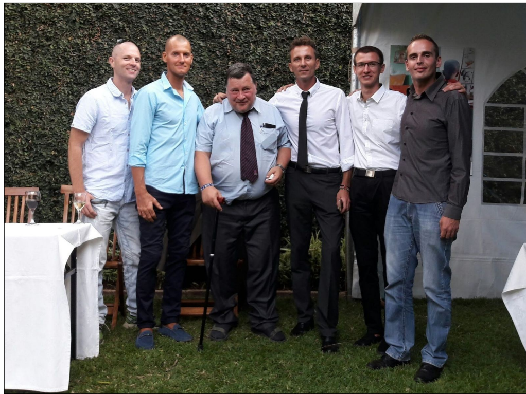
Február 2017. Slovenske Velvyslanectvo-Nairobi. Vďaka za všetko čo ste pre svet urobili.