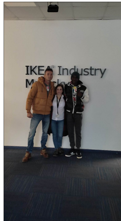
Na exkurzii v IKEA Malacky.