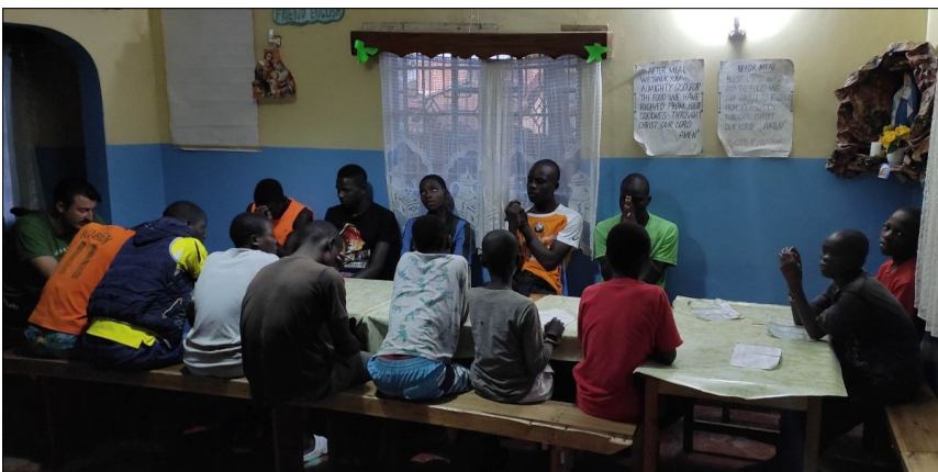
Modlíme sa večerný ruženec.