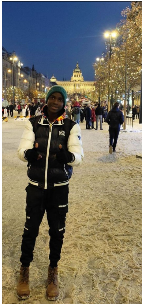
Eugene v Prahe. Václavské nam.