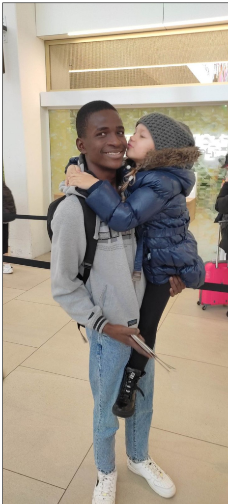
Posledné bačko o Nelky na letisku.