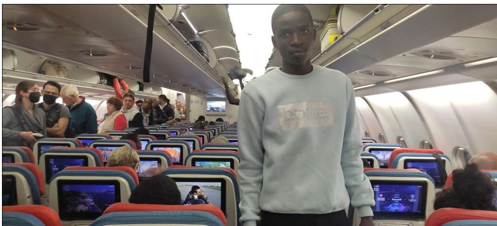
Eugenov prvý let.