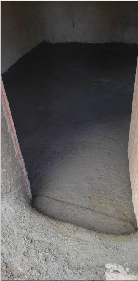
Namiesto cimentu,,kravske lajná.