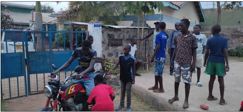
Učia sa jazdit na motorke.