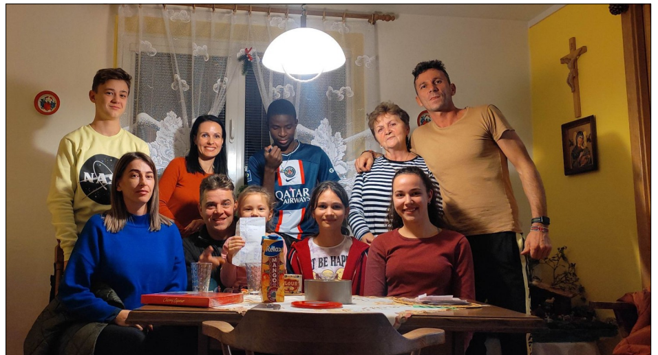
Posledné rozlúčkové rodinne foto.