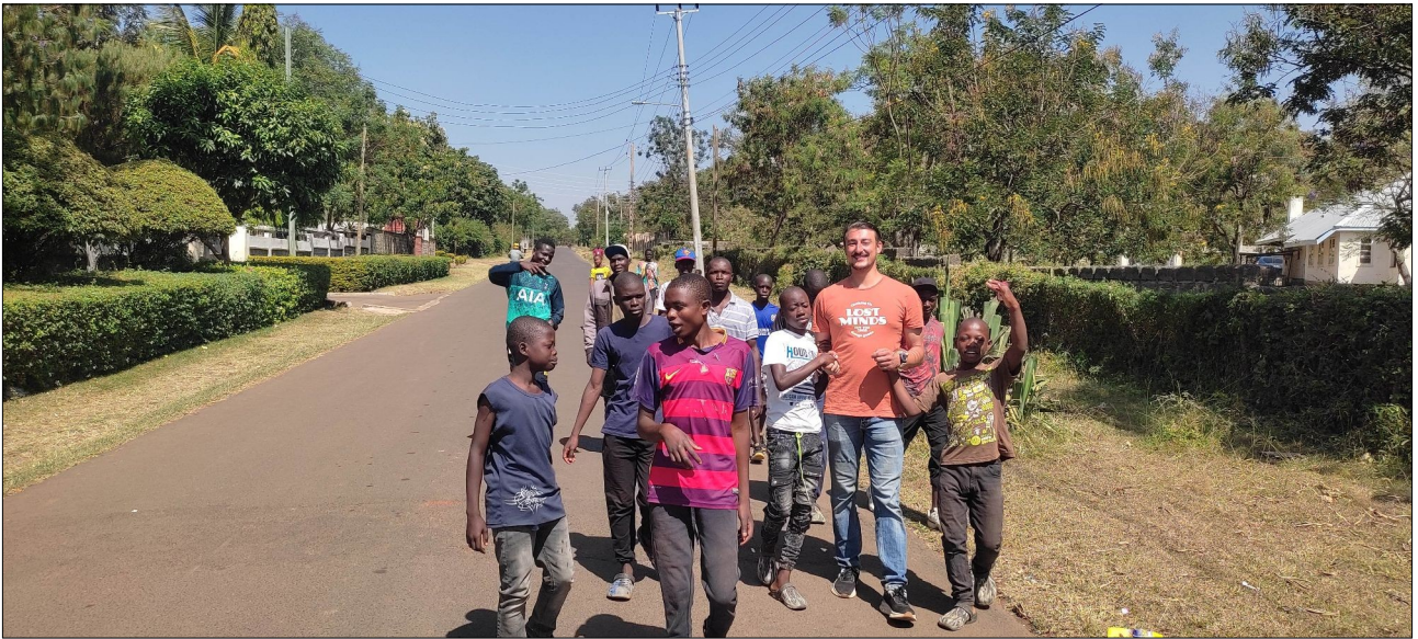
Ideme z kostola.