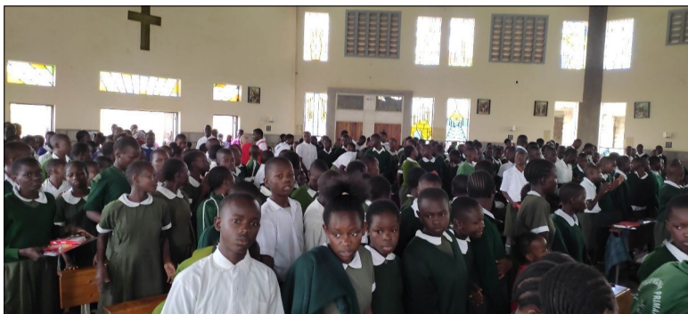
Omša pre študentov a ich žehnanie pred KCPE skúškov.

Do nášho centra zavítali aj noví chlapci priamo z ulice. Počas tohto času ich prišlo okolo 10. Píšem okolo, lebo veľa z nich častokrát odíde naspäť na ulicu. Závislosť od fetovania lepu a sloboda, ktorú majú na ulici, je u niektorých veľmi veľká. Sú to chlapci okolo veku 10 – 15 rokov. Myslia si, že sú ešte mladí a majú ešte čas. Niektorí utečú, vrátia sa a znova utečú. Je to tak, polovica takmer vždy odíde. Veľkým problémom sú aj krádeže, ktoré v centre máme. Niekedy si pripadáme ako na policajnej stanici :). Tresty za krádeže v Keni sú privysoké a veľakrát skončia aj smrťou. Ľudia tu niekedy na políciu nečakajú a vyriešia si to po svojom. Dotyčného hriešnika doslova upália za živa, keď mu okolo pasu dajú pneumatiku a polejú ho benzínom. Robia to verejne...na výstrahu pred všetkými.