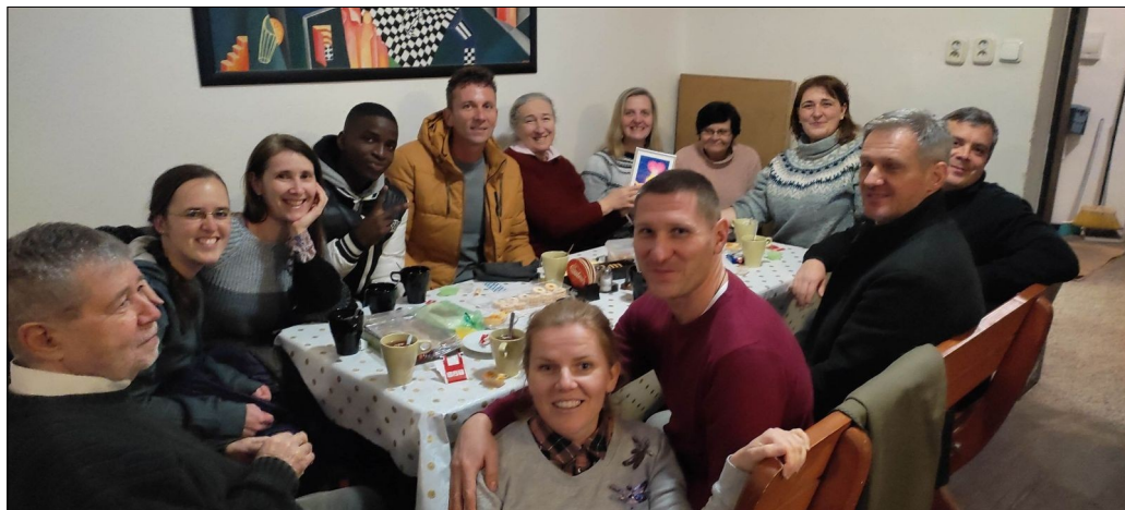
Modlitbové stretko na Hlbokej.