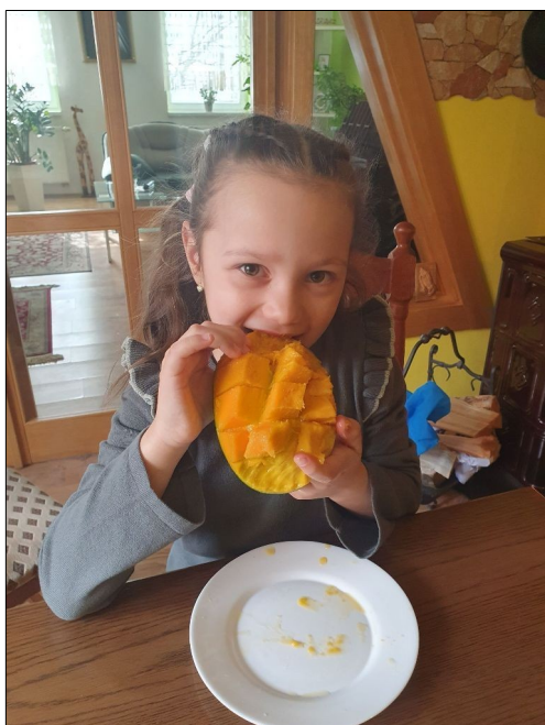
Najlepšie mango je z Kene.