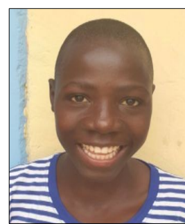
Chlapci ktorý prišli do nášho centra Filipa Neriho.