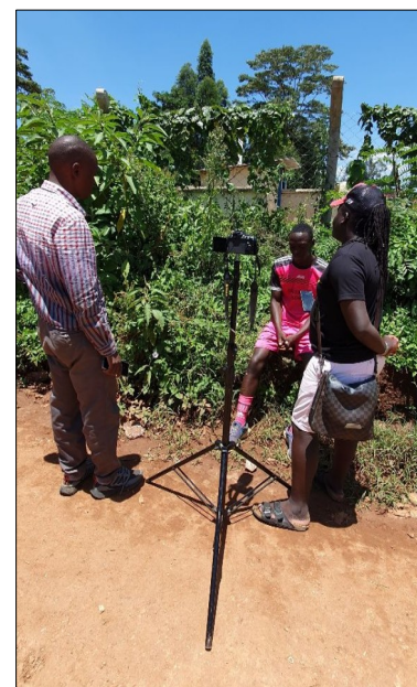
Robíme taký dokument o našom centre.