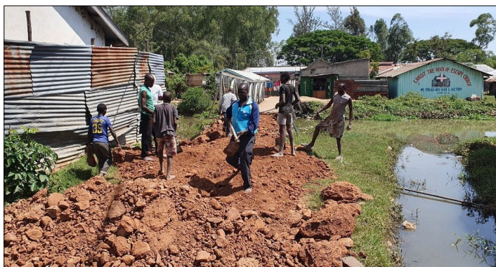
Pomoc pre komunitu...opravujeme cestu.