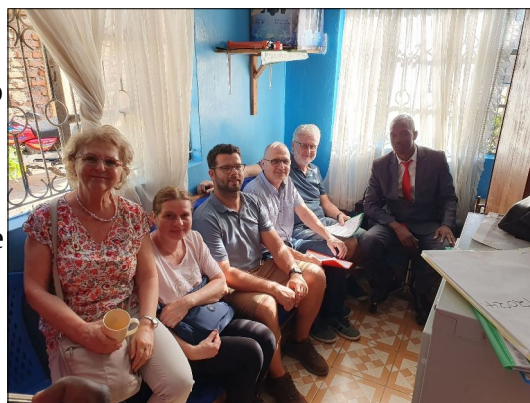
Hostia zo Slovenska

Dokonca sú pod dohľadom polície, aby náhodou neutiekli. Dvom chalanom sme pomohli k tomu, aby sa aspoň trochu postavili na vlastné nohy. Sú to naši prví, ktorí ukončili strednú školu. Ak takýto chlapci nemajú žiadne zázemie a rodičov, tak im aspoň trochu pomôžeme začať. Jednému sme kúpili veci na otvorenie biznisu k predaju párkov na ulici. Druhý chcel predávať secondhand oblečenie. Uvidíme ako im to pôjde. Podľa momentálnej situácie to vyzerá tak, že predávať párky bude výhodnejšie ako predávať oblečenie.