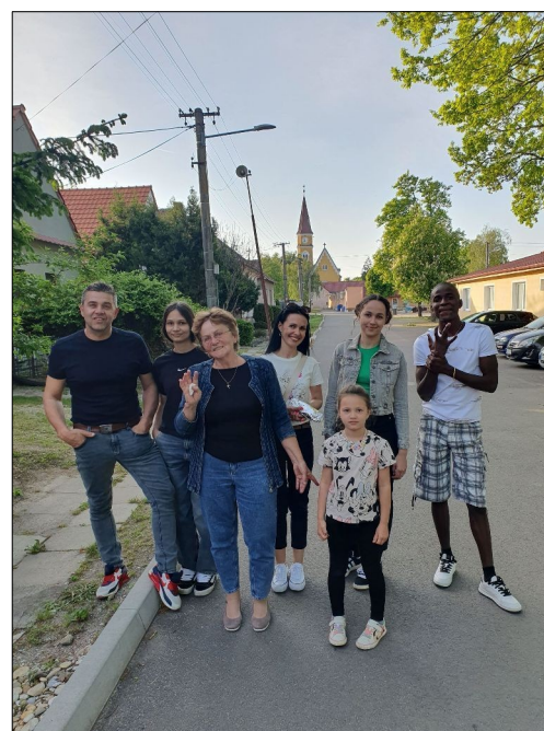
Posledna večera na sk.