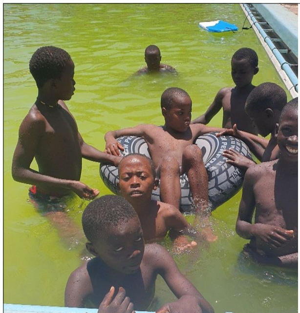
Krištálovo čistá voda :)