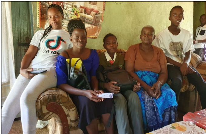
Na navšteve u Krispina.