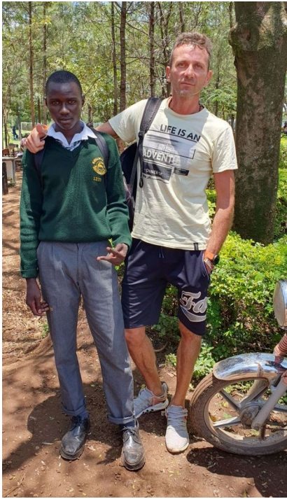
Po rodičovskom združení.