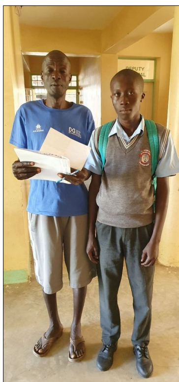
Pomoc pre chlapca z komunity.