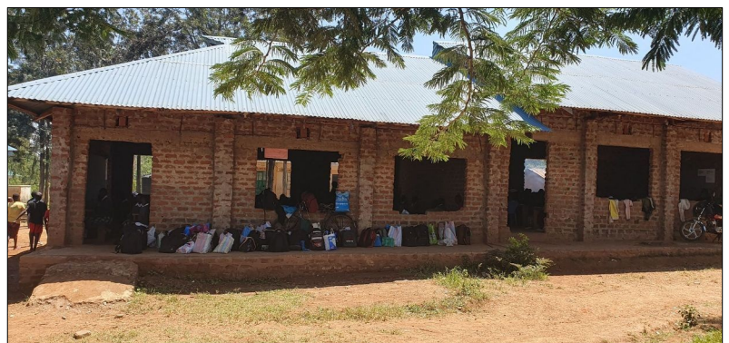
Skola funguje aj bez dverí a okien.