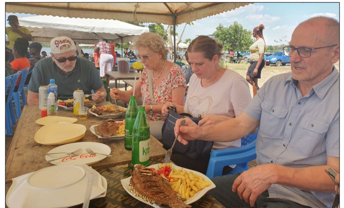
Každý kto pride do Kisumu musí okoštovať rybu.