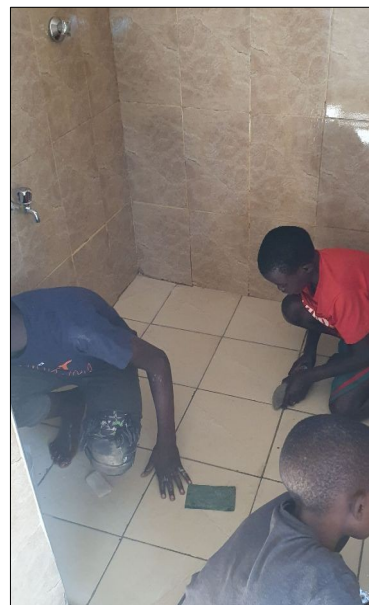
Treba vsetko vyčistiť...ide nám navšteva.