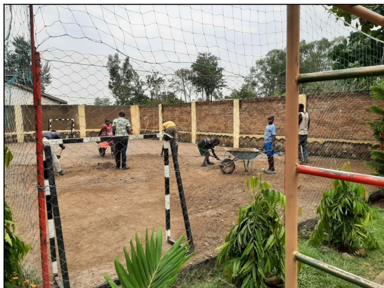
Odstraňujeme starý betón