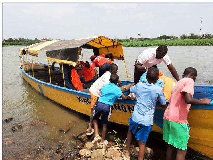
Ideme sa plaviť..Jazero Viktoria