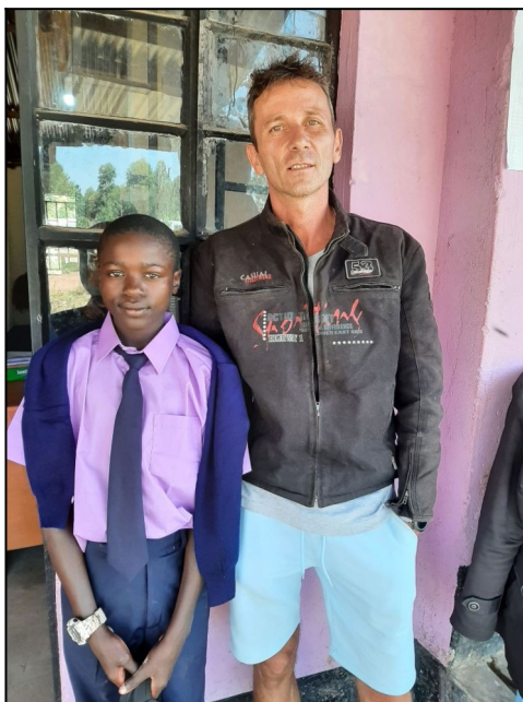
Prvy den v škole form2 Briton15