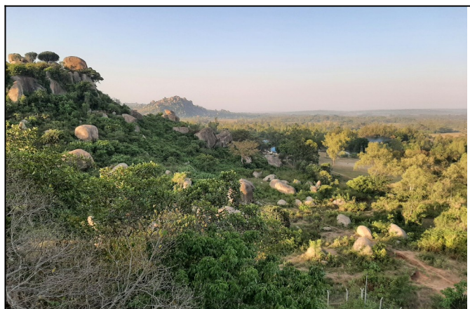
Krásí divokej Kene...