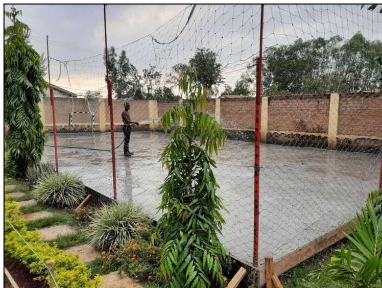
Ihrisko je hotové