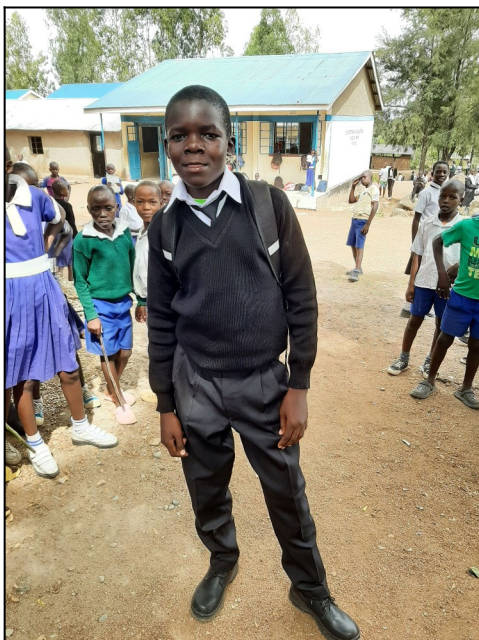
Davis class 8