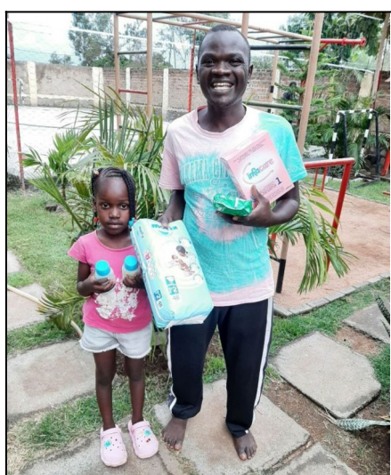
Pomoc-narodili sa im dvojičky