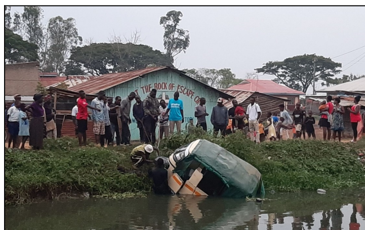
Ked sa viaczej popije.