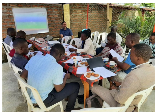
Míting centier z Kisumu - v našom centre.