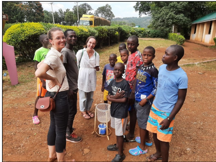
Na rovníku v Maséne