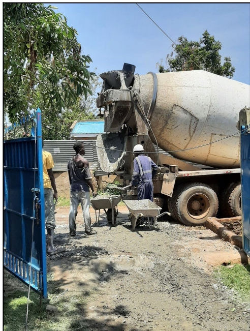
Priviezli betón na ihrisko