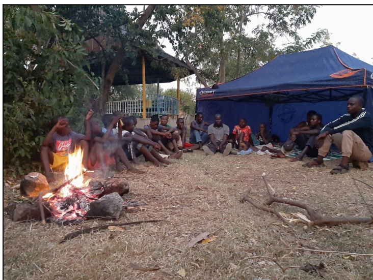
Na stanovačke..modlime sa ruženec.