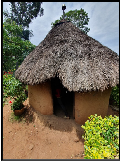
Kuchyna v Nandi Hills