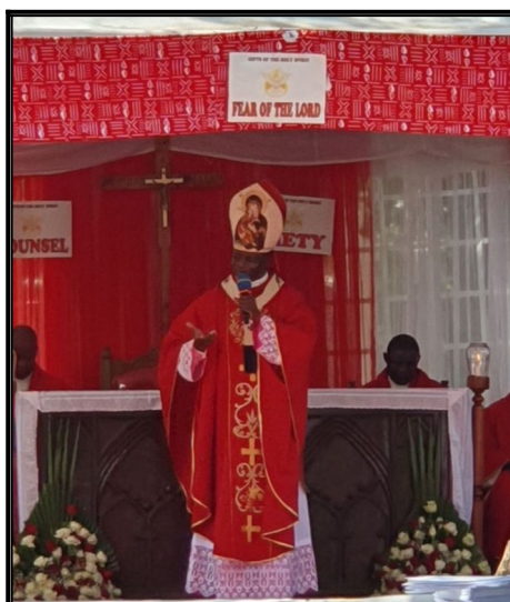
Pán Biskup keď dorazil na Birmovku z oneskorením :) sa ospravedlnil.