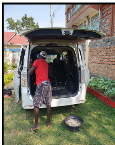
Chlapci na celom svete radi umývajú autá.