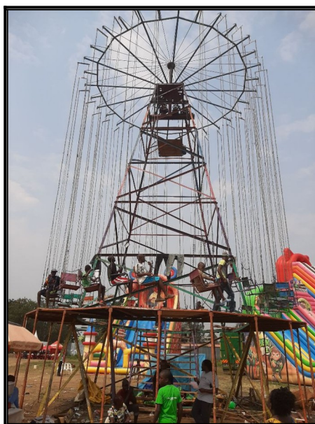
Kolotoč vyzerá ako keby ho kolotočári sami robili.