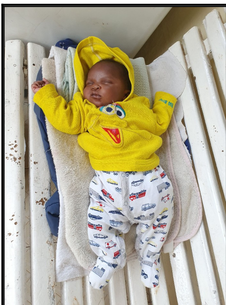
Novorodenec ktorého majiteľ domu poslal na ulicu aj z mamou a súrodencami.