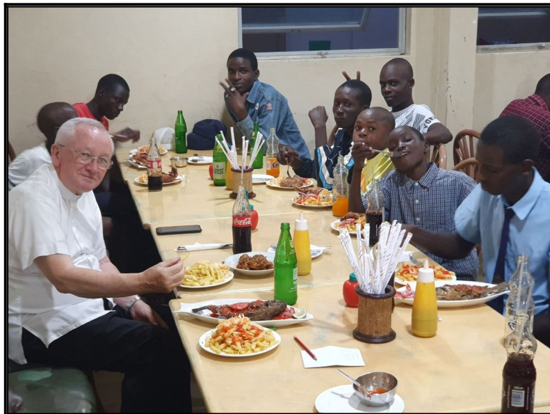
Otec Corner-kňaz-nás pozval všetkých na večeru.kde sme sa super najedli.