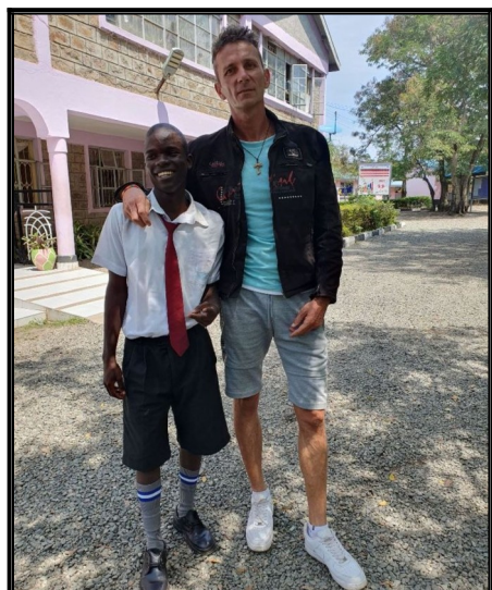
V škole kde sa cestuje Vodným autobusom..Mbita sec school