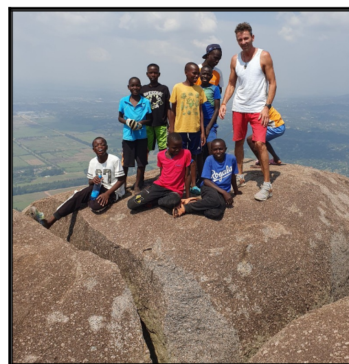
Výhľad na Kisumu z výšky 2000m