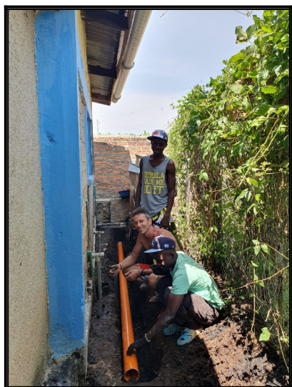
Výmena kanalizačnej rúri