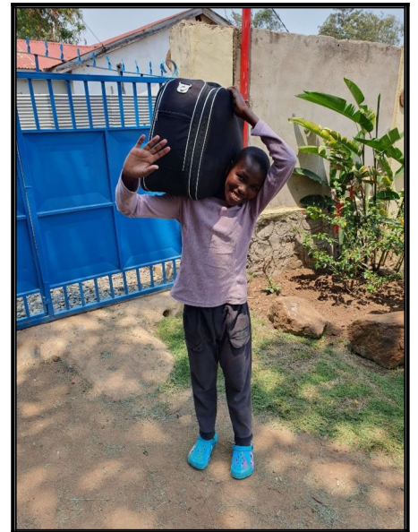
Prázdniny sa skončili...treba ísť dom.