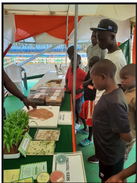
Na vystavisku AGRO