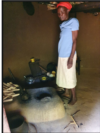
V takejto kuchyni smrdíte za 2 sekundy ako údenáč :)