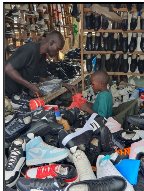
Kupujeme topanky do školy.