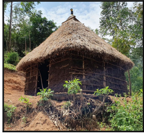
Novostaba na kopci.