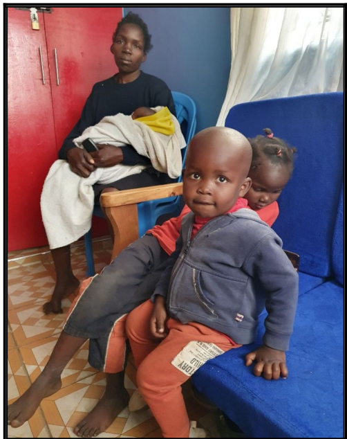
Táto matka z 3 detmi-najmladsie 3 týždne- bola vyhnaná z domu zato ,že nezaplatila nájom.....samozrejme sme jej pomohli a situácia sa ako tak vyriešila.