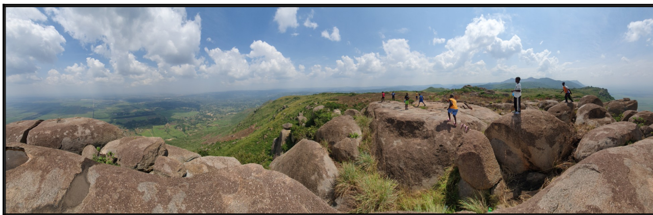
Na vrchole vo výške asi 2000m ako na Chopku.