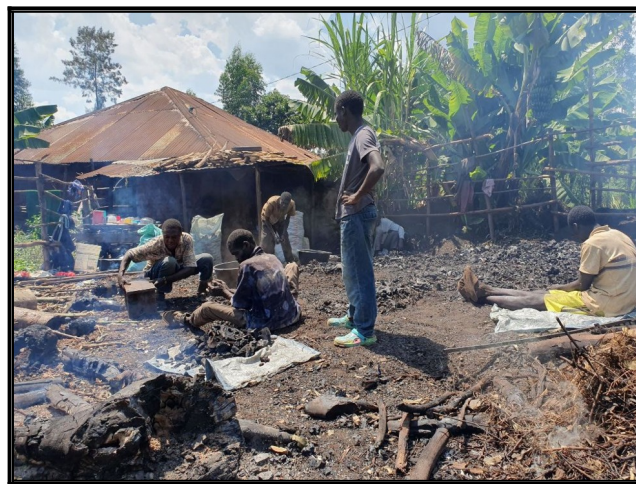
Vyroba a miesto kde sa predáva drevené uhlie.