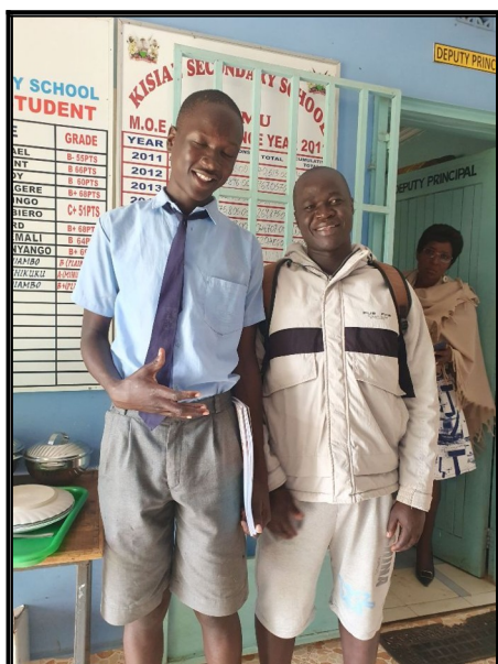
V škole u Fidela Castra...náš socialny prac.Mozes