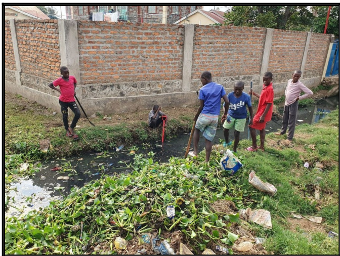
Cistenie okolia nášho centra...bordelu až,,až.