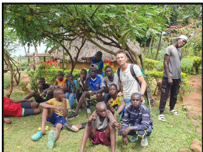
Na výlete z chalanmi.....túra.