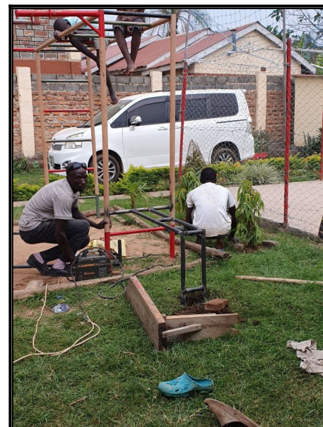
Zlepšujeme našu posilovnu co máme vonku....mame nove lavičky.