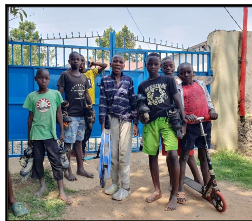
Kolieskové korčule a skútre zo slovenska.