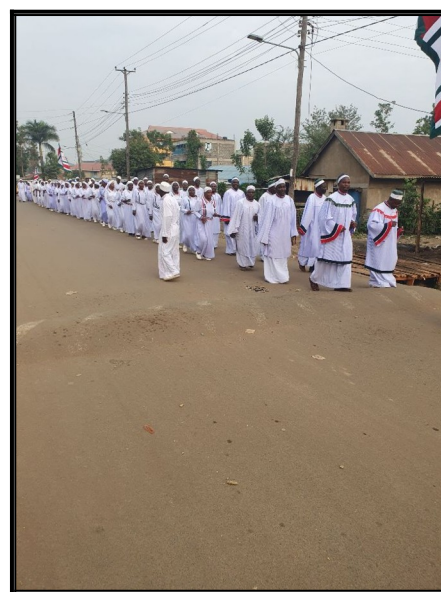
Ranná procesia miestnej kresť. cirkvi ROHO