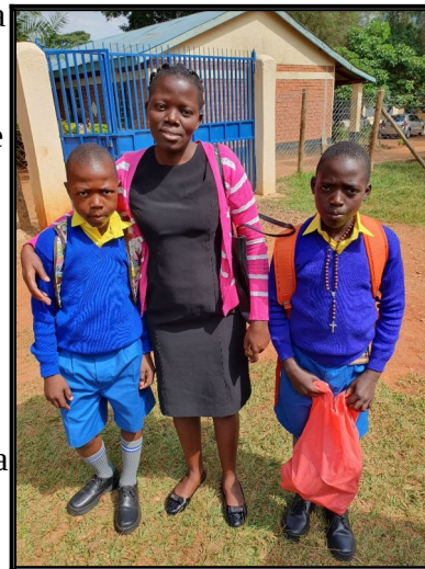
Prince a Michael su pripravený do školy.