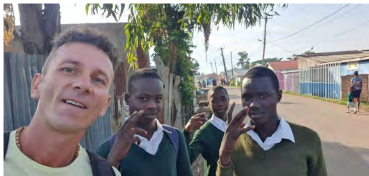
Ideme na rodičovske .