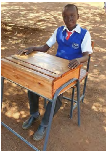
Nova lavica pre Evansa