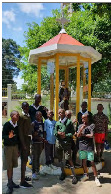
Sviatok Filipa Neriho