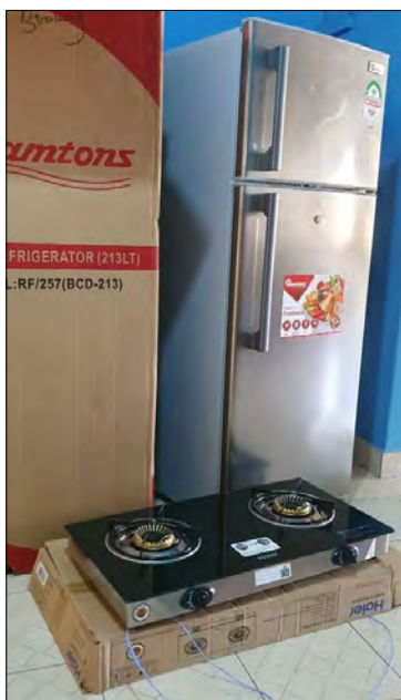
Dar od jednej pani...nová ladnicka a plynový šporak.