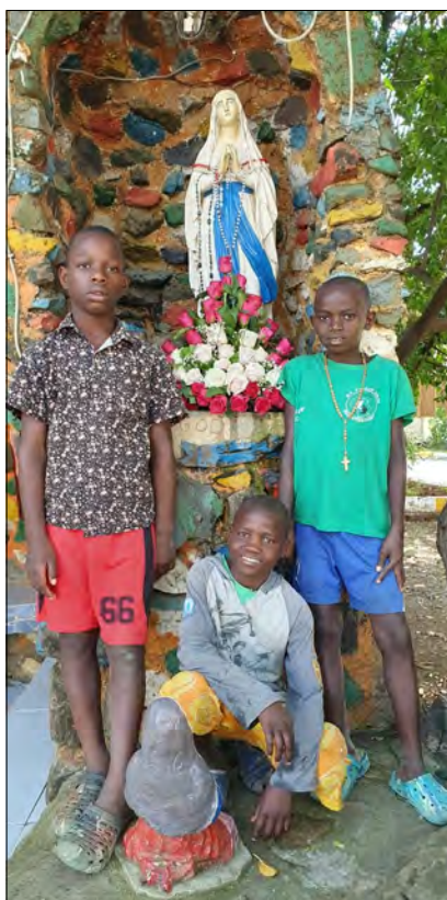
Sviatok všetkých matiek....aj ta nebeskej.