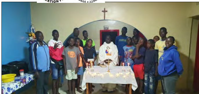
Sv.omša v našom centre.