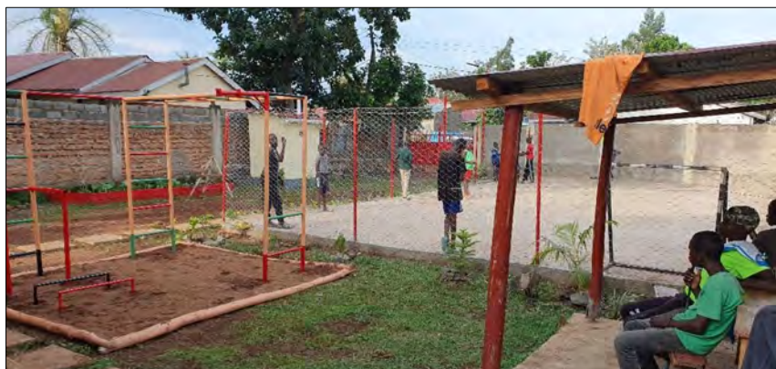
Prazdninový den v centre.