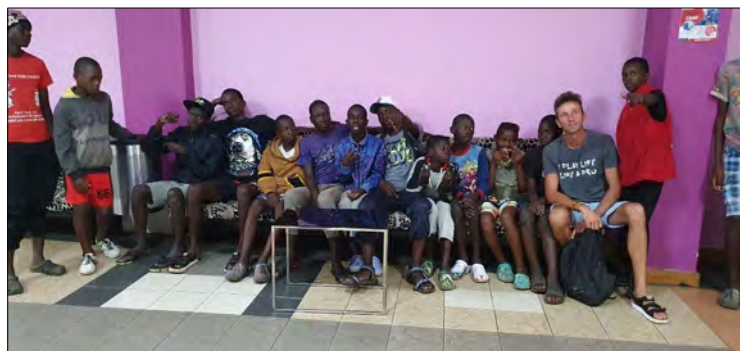
Boli sme v kine.Den deti 1 jún