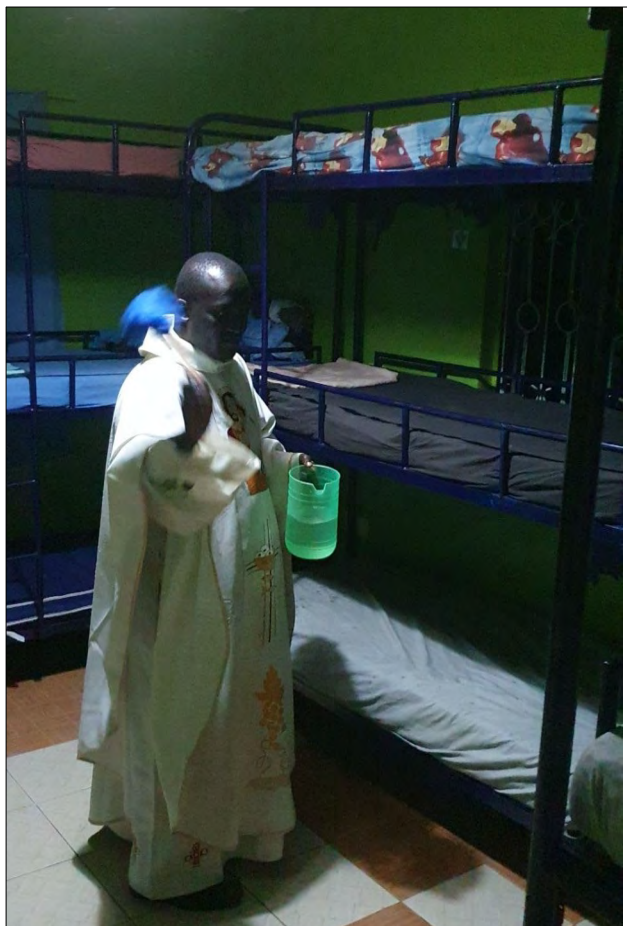
Pán farár svätí centrum.