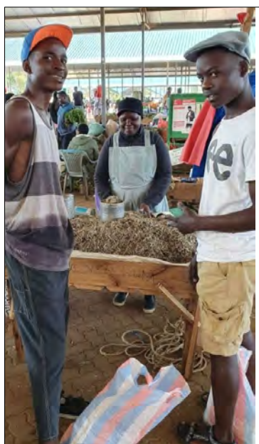
Kupujeme Omenu....male miny rybičky.