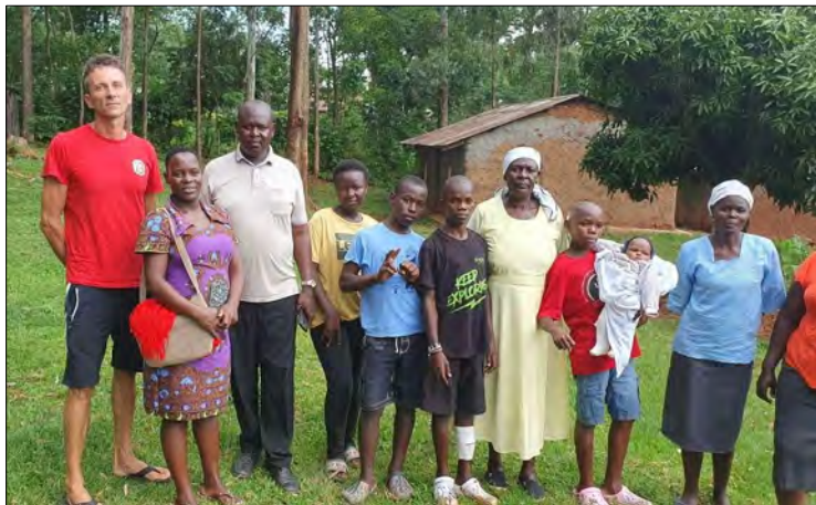
Domáca navšteva. Griffin1č -chlapec čo drži male dieťa.