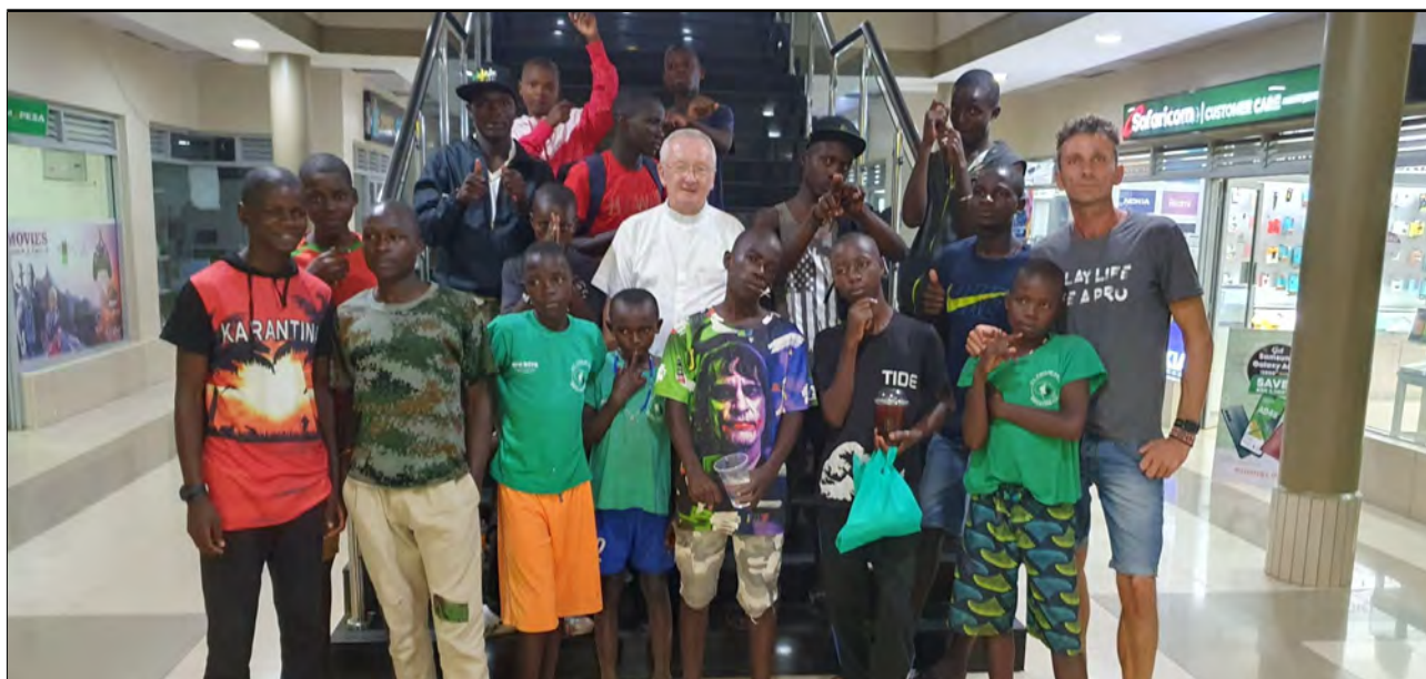
Pozdravujem Vás pán profesor a všetkých ostatných,

píšem Vám správu z centra Filipa Neriho v Kisumu – Keňa za mesiace maj a jún. V centre sme mali, a teda aj máme okolo 14 chlapcov vo veku od 10 do 18 rokov. Počas tohto obdobia k nám prišlo dosť nových chlapcov, no veľa z nich opäť utieklo na ulicu. Dokopy prišlo okolo 10 chlapcov. Vôňa lepu a slobody je pre nich niekedy viac ako by sme si mysleli. Ale nie všetci vzdali boj tak rýchlo. Do školy sa nám podarilo umiestniť štyroch chlapcov, čo nie je až tak málo na centrum ako je naše. Na prvé domáce návštevy sme išli štyrikrát.