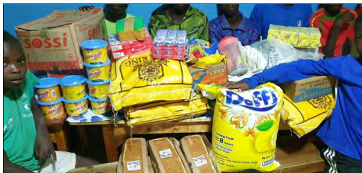
Dar od Dominiky