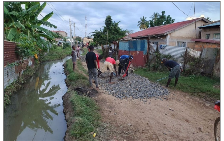
Pomoc pre komunitu ..kamene na opravu cesty.