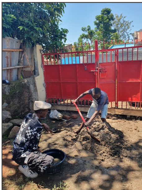
Stavíme múr proti vysokej vode.