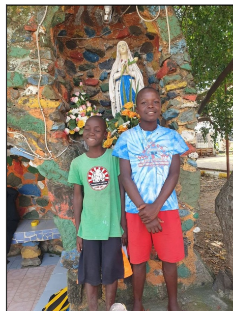
Den matiek...aj tej nebeskej.