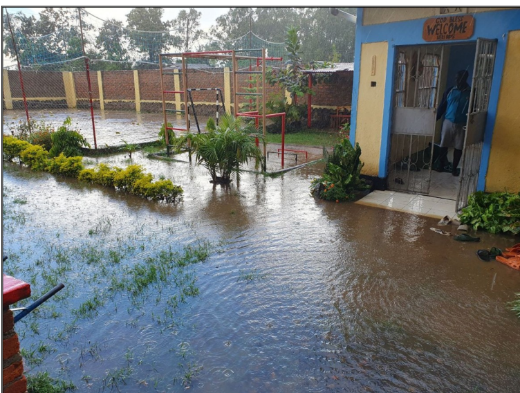
Chýbal len kúšček.