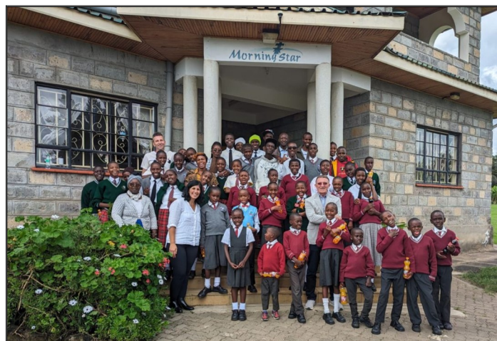
Centrum ST Theresa v meste Naivasha ,kde som bol a kde sa vždy rád vraciam.