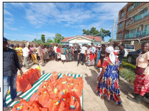
Pomoc pre ľudí