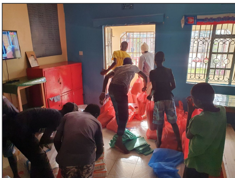
Balíme pomoc pre ľudí postihnutých povodňami.