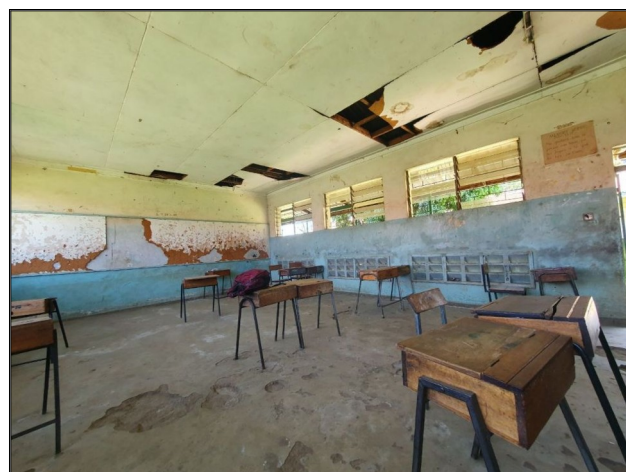
Aj takto veľa krát vyzerajú triedy v školách. Takže ak si myslíte že mate nie peknú triedu...spomeňte si na túto.