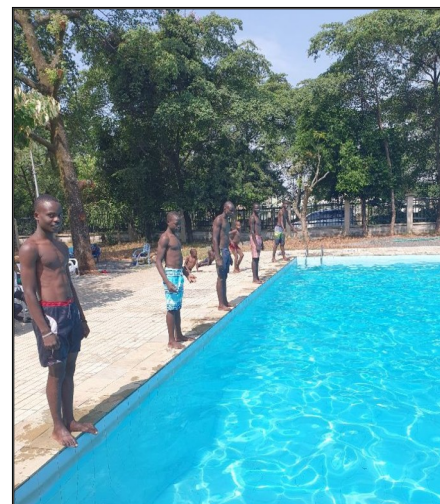
Nedeľ a- kto bude najrýchlejší.