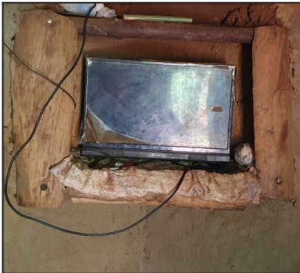
Jedinečný držiak na televízor,ktorý nikde nevidíte.