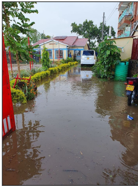
Povodne v centre