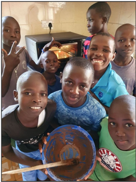
Peče sa bublanina v novej trúbe od darcov z Devinskej Novej Ves