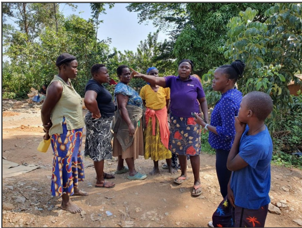
Obamova mama vysvetluje situaciu v rodine miestnym ženám.