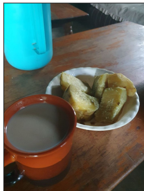
Obed u Eugenovej starešky