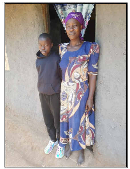
Na domacej navšteve Briton 16r