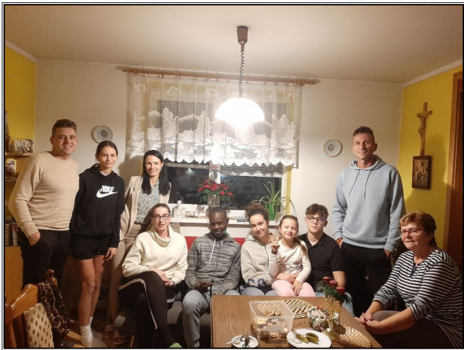
posledná rozlúčková foto