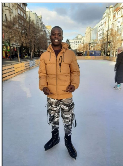
Prvý x na korčuliach-Vaclavák-Praha