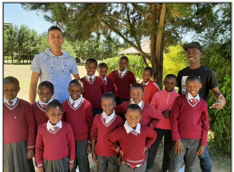
V centre Sv Tersie.....Naivasha