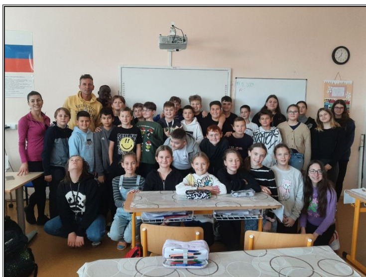
Na základnej škole v Sekulách.