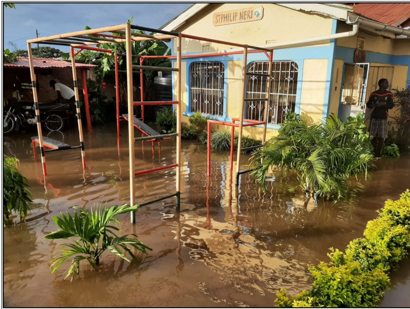
Povodne v našom centre