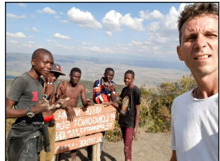
Na sopke Longonot 2777m