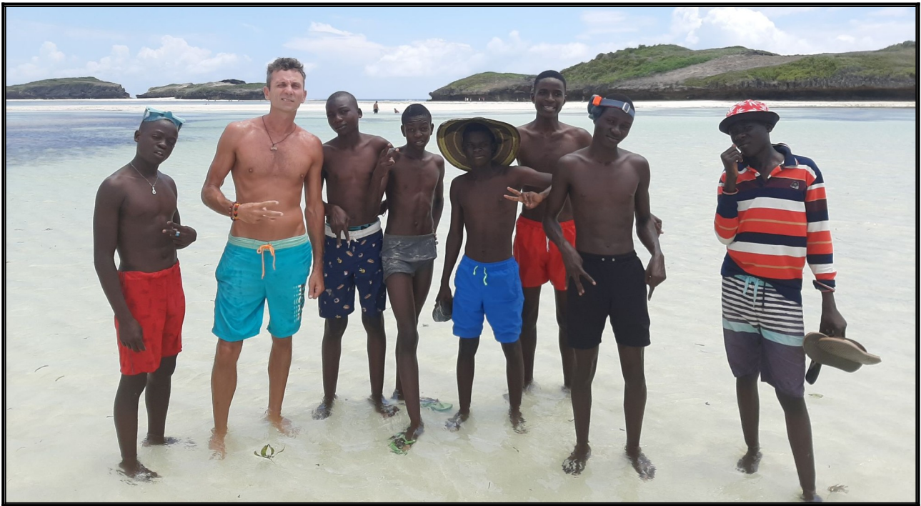
Pozdravujem Vás pán profesor, aj všetkých ostatných,

píšem Vám report z centra Filipa Neriho v Kisumu, za mesiace november až január. Je to dlhšia doba, počas tohto času som bol toho 6 týždňov na Slovensku a v Keni sme mali s 10 týždňov prázdniny. Počty chlapcov, ktorí boli v centre sa pohybovali okolo 18 a niekedy aj trochu viac. Bolo to hlavne počas Vianoc. Mimo tohto obdobia sú počty menšie, a to kvôli spacej kapacite, ktorú v centre máme. Vekové zloženie je od 10 do 19 rokov.