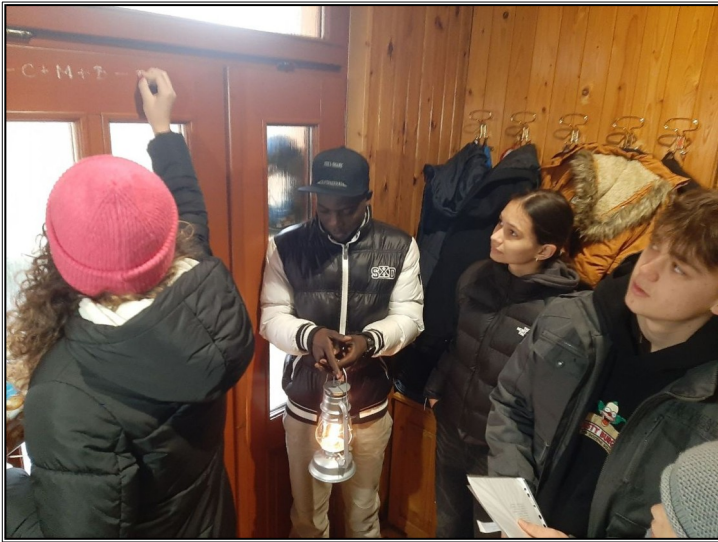
Koledovanie Dobrá novina