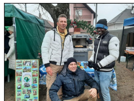
Vianočné trhy v Závode