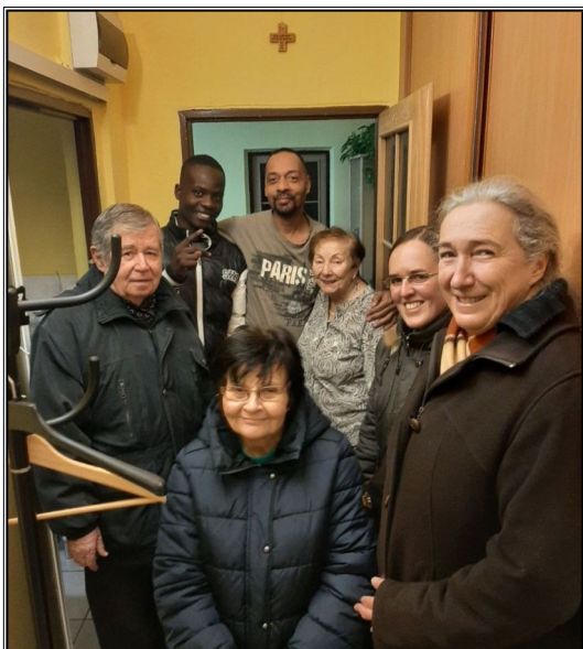
Skupina selezianov z Don Pravdom-slovenským misionarom