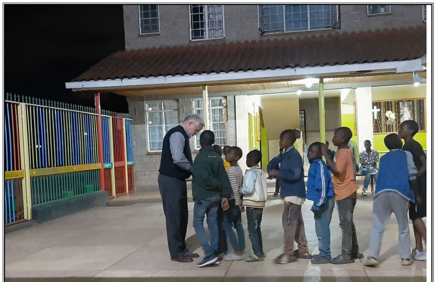
Bosco Boys....chlapci su požehňavany kňazom pred spaním.