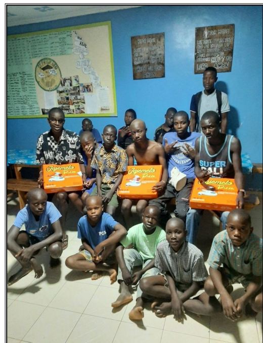
Pizza na privätanie.