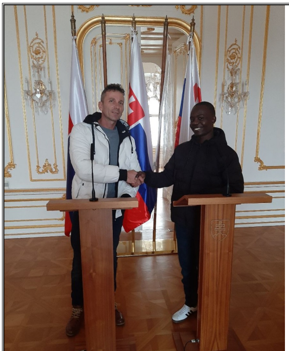
Privítanie na Bratislavskom hrade