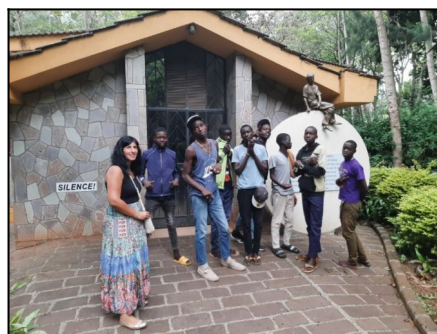
Zahrada Vzkriesenia...zo Chisou