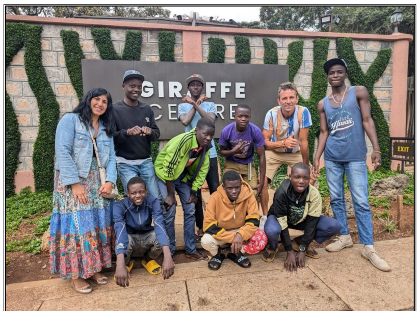
V zirafovom centre zo Chisou,,,,, v centre bolo možné žirafi aj krmiť.