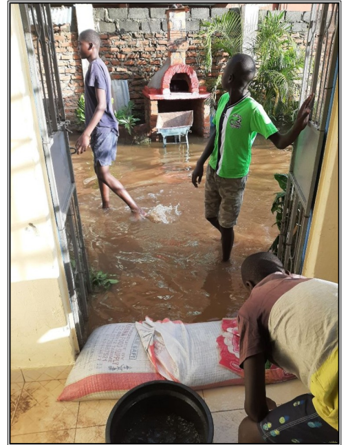
Povoden v našom centre