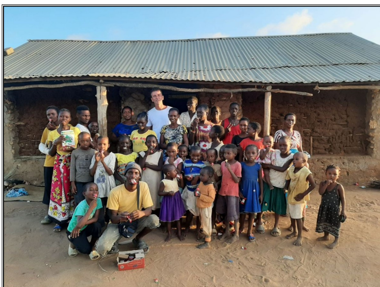
V dedine Majengo...na pobreží.Ľuďom sme priniesli Múku,Ryžu a mydlo