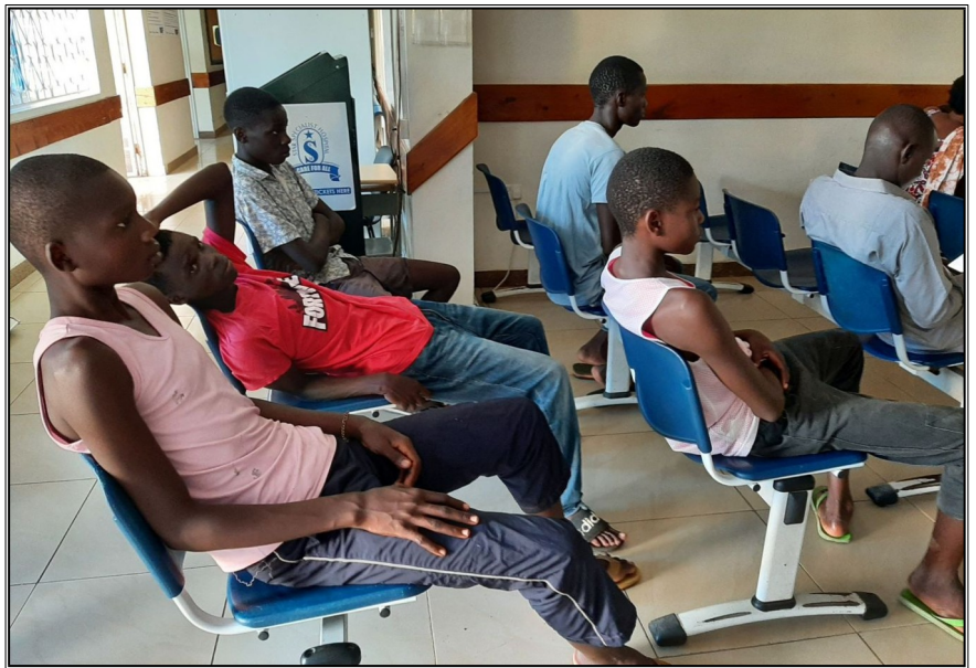
Počet otrávených sa zvýšil na 5...sedime v nemocnici.