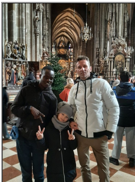
Stefanska katedrála vo Viedni