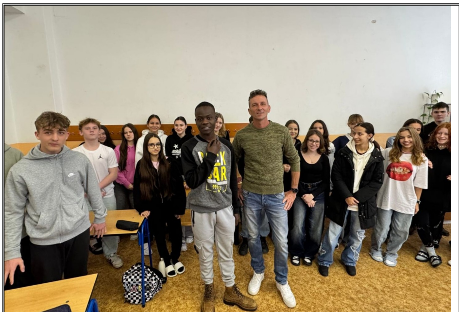
Základná škola v Závode...deviatici.