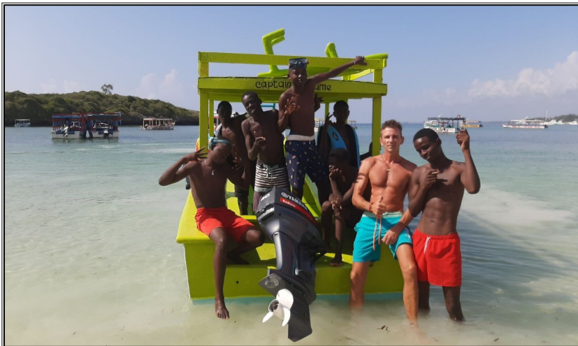
Watamu....ideme na delfiny.