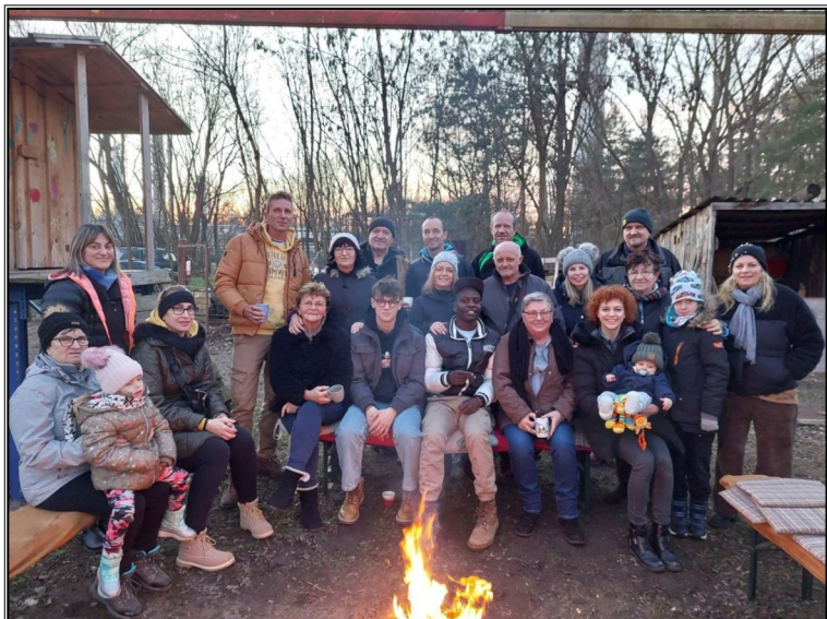
Jedna rodinná táboráková...:)