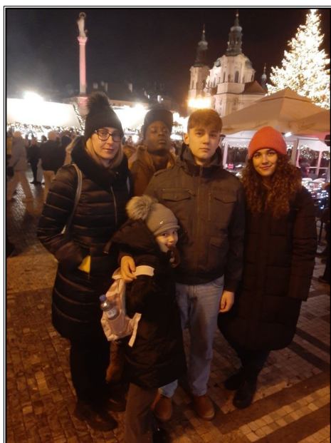
Vianočné trhy v Prahe