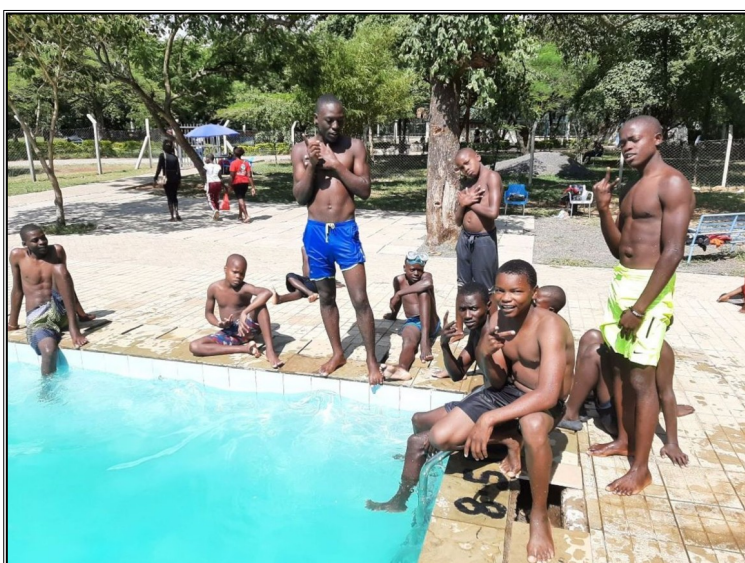
Nedela....moja prvá nedela v tomto roku v keni