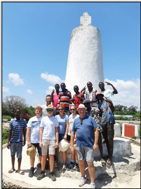
Vasko de Gama-zo slovenskými turistami.