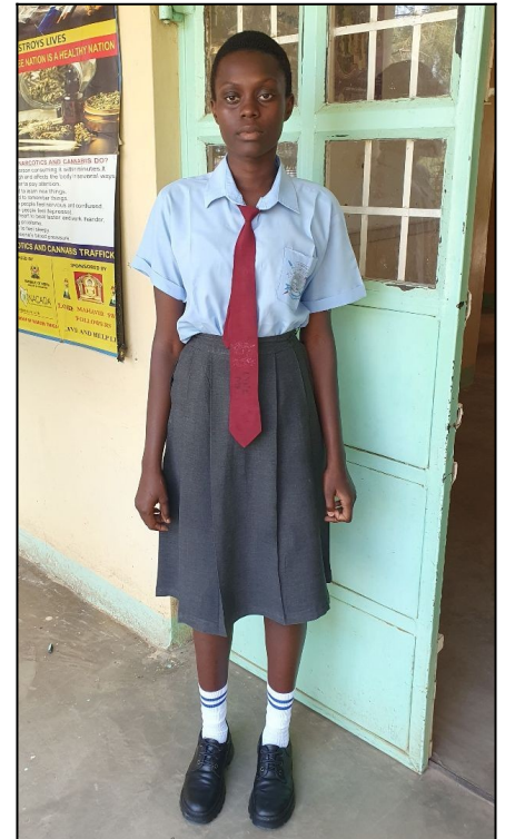
Poline,,,,,je v škole vďaka vám (LM) .....Form2