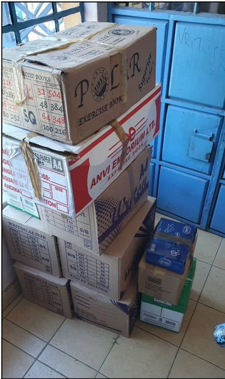
Skolske pomocky od nasich dobrodincov