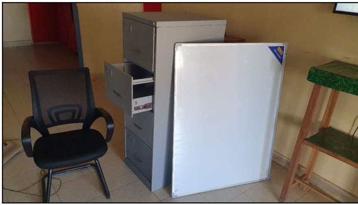
Stolicka, tabula a plechová skřina od firmy Hollen