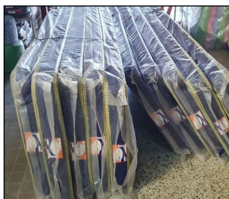
Matrace od firmy Hollen