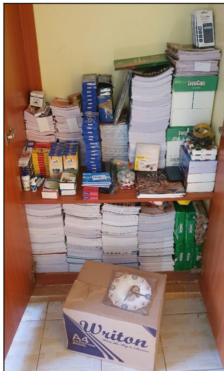
Všetko vybalene a nachystané