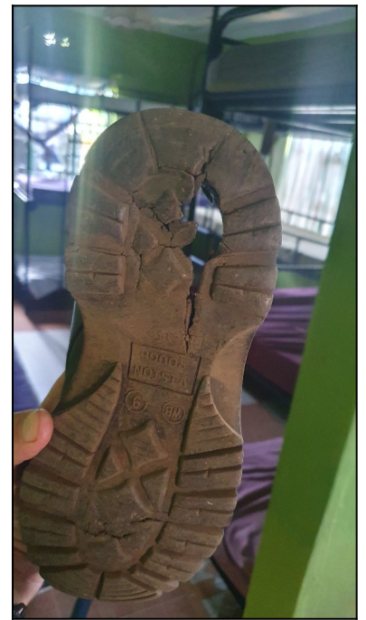
Keď máte do školy tam aj späť 8km