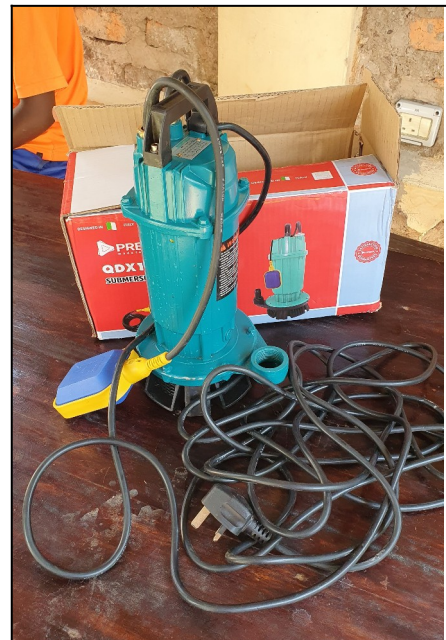
Cerpadlo ..firma Hollen