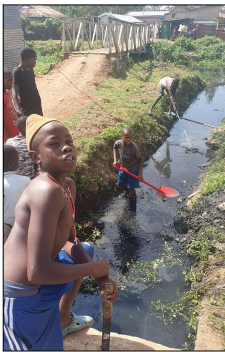
Cistíme okolie centra