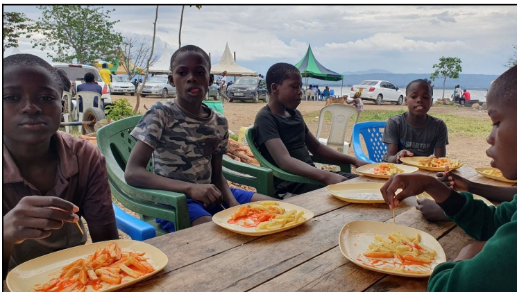
Na hranolkach v nedelu.....