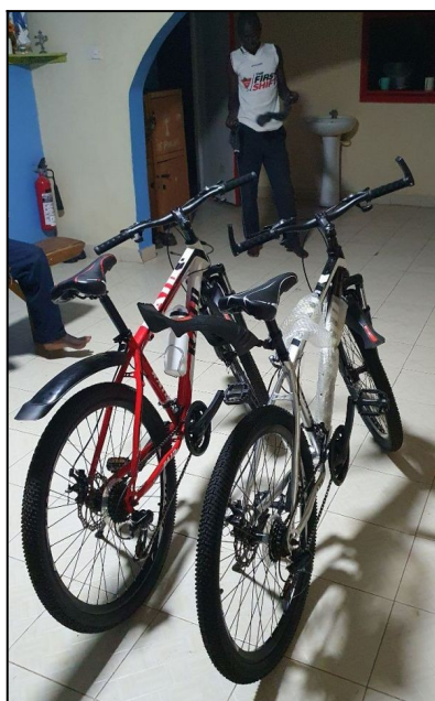
Bicykle firma Hollen