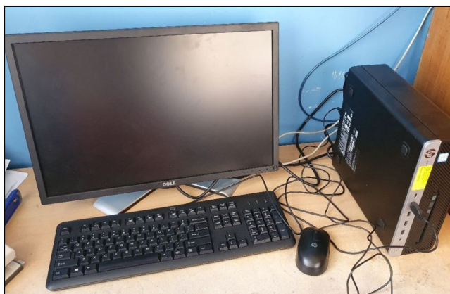
Stolový počítač od firmy Hollen