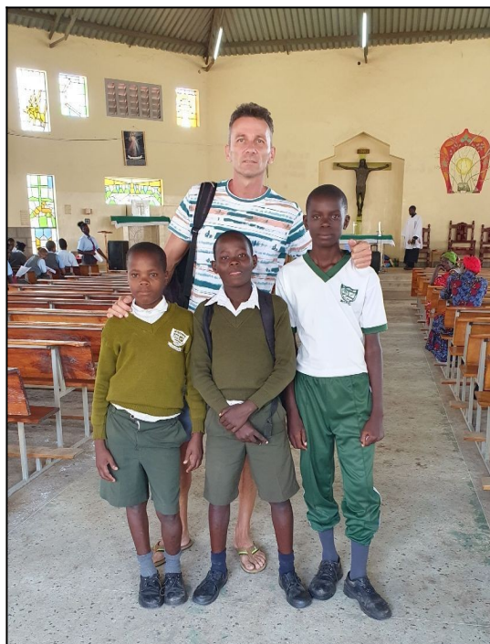
Naši šiestaci v StVitalis PS