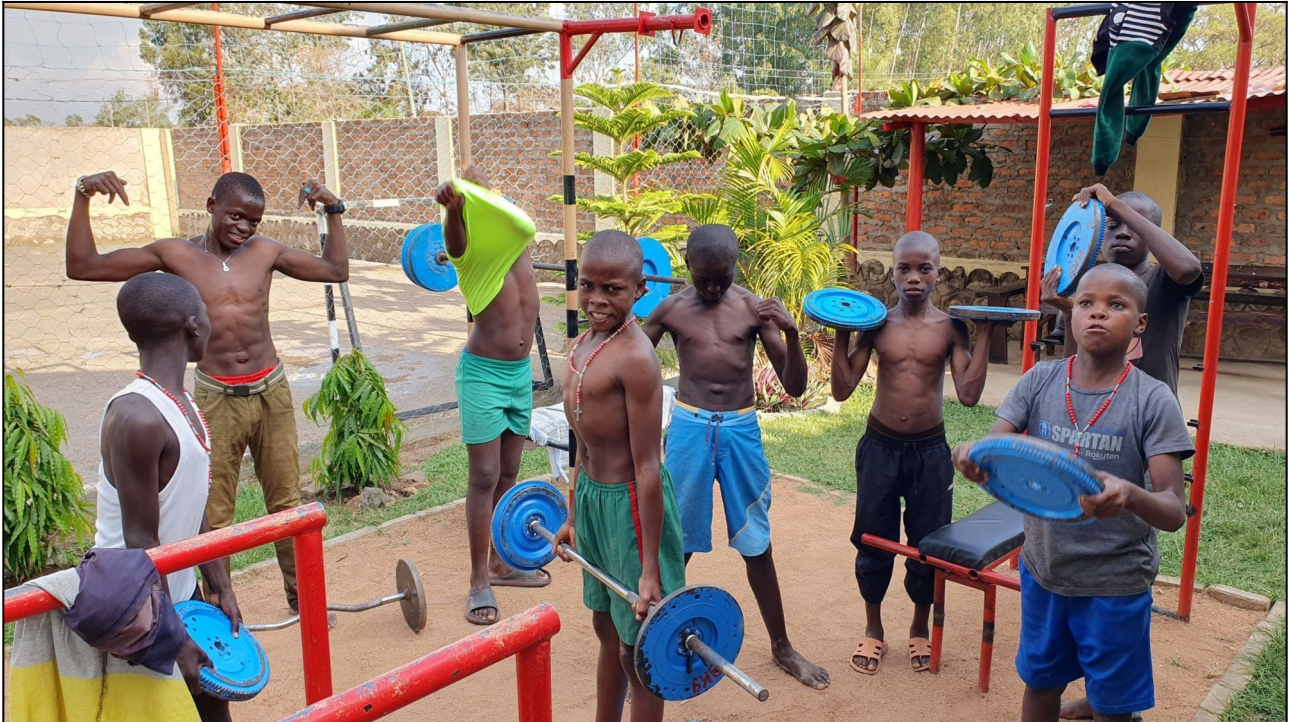
Pozdravujem Vás pán profesor, aj všetkých ostatných,