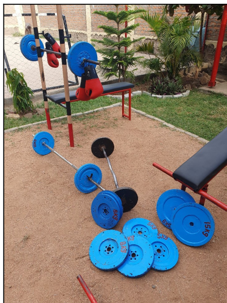
Veci na posilnovanie firma Hollen