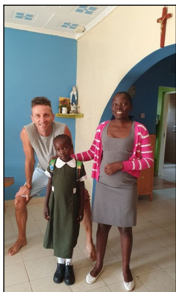
Dillanova sestra class 1