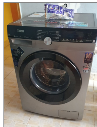
Pračka. od firmyHollen