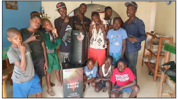
Rádio od firmy Hollen