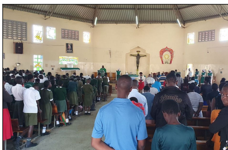
Zaverečná sv omša pre šiestakov