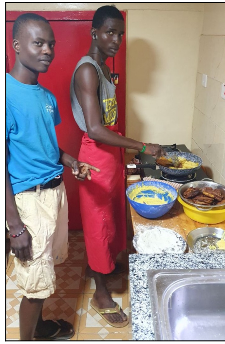
Pražíme kuracie jättra k večeri