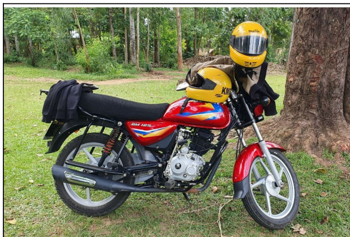
Moja motorečka Boxer 125